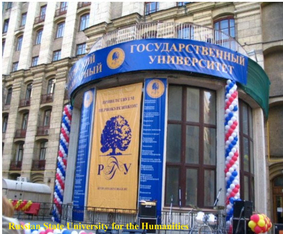
Russian State University for the Humanities