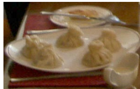
Pratos do Kavkaz Bar

No restaurante Kavkaz Bar (КАВКАЗ БАР, em cirílico) serve-se cozinha da Geórgia. O guia de viagens Frommer's ( www.frommers.com ) recomenda o khinkali, bolinhos de massa cozidos e recheados de carne apimentada (veja as fotos). Experimentei e aprovei!